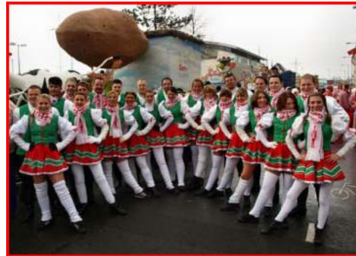
Höhepunkt einer jeden Session ist die regelmäßige Teilnahme am Rosenmontagszug in Köln.