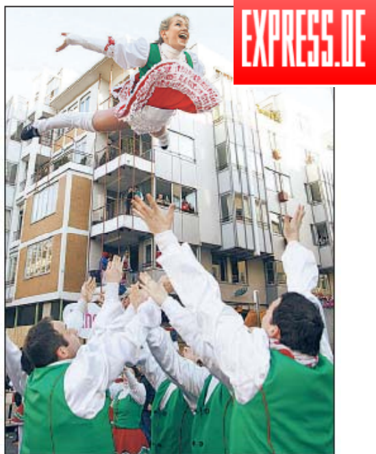
Ein echter Hingucker – die Tanzgruppen mit ihren Mariechen